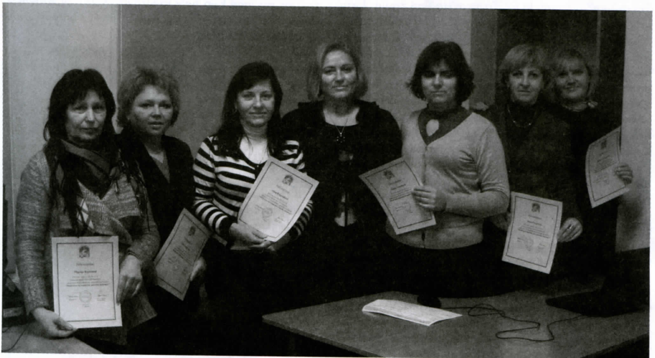
Kursų dalyvės su įteiktais pažymėjimais

Kursų klausytojos džiaugėsi aiškiai, suprantamai ir išsamiai pateikta medžiaga. Jos neabejojo, kad įgytos žinios joms bus naudingos ieškant informacijos.