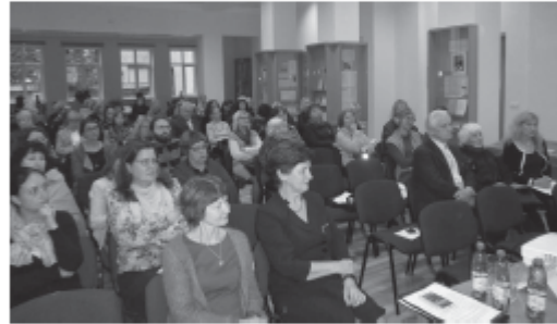
Konferencijos dalyviai.