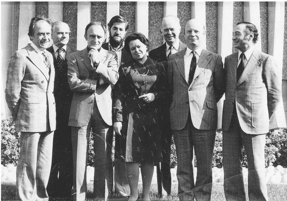
Tarptautinio vėžio tyrimo centro (Lionas) skyrių vadovai, 1978