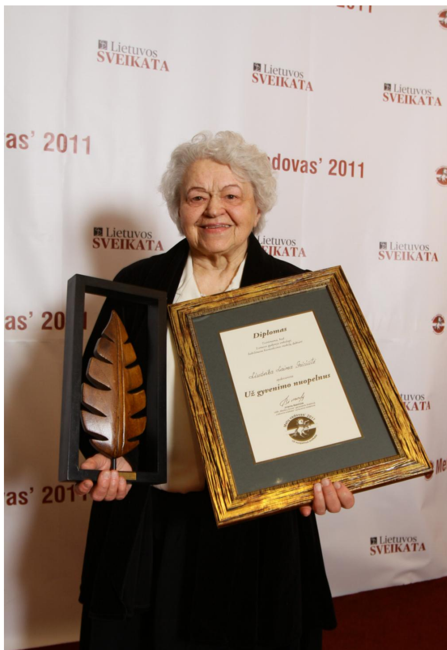
Apdovanojimas „Už gyvenimo nuopelnus“, 2011