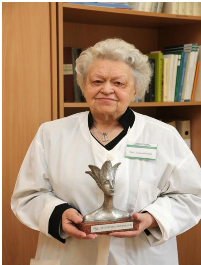
Apdovanojimas „Už gyvenimo nuopelnus“, 2009

Už atsidavimą Lietuvos onkologijai profesorei skirta žurnalo „Moteris“ ir medicinos savaitraščio „Lietuvos sveikata“ specialus apdovanojimas „Už gyvenimo nuopelnus“.