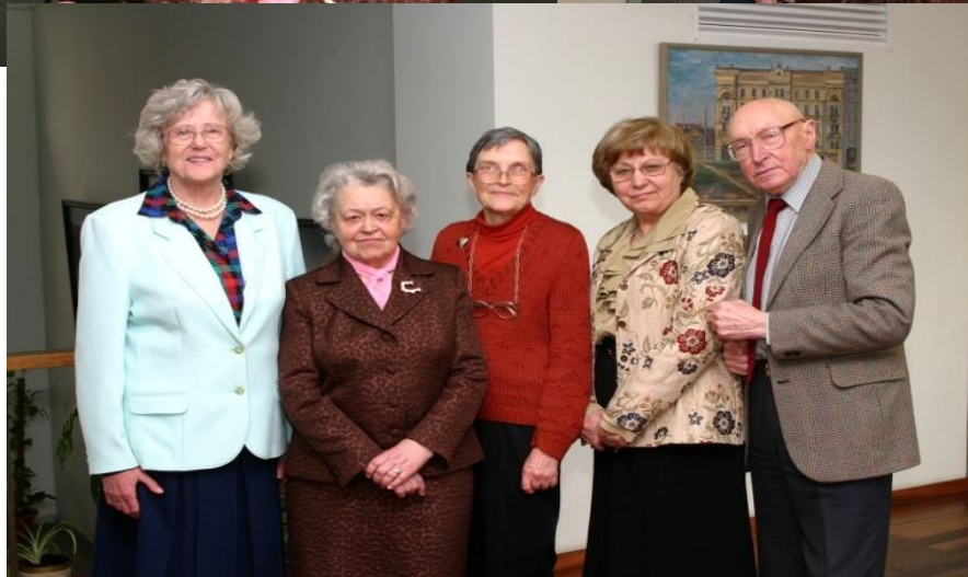
Sveikinimai 80-ties metų Jubiliejaus proga, 2006