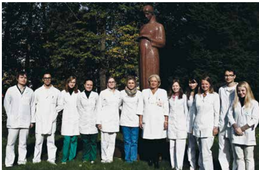
Jaunųjų kolegų būryje

ga, 1999 m. balandžio 30 d.–gegužės 7 d. – Vilnius: UAB „Meralas“, 1999. – P. 77.