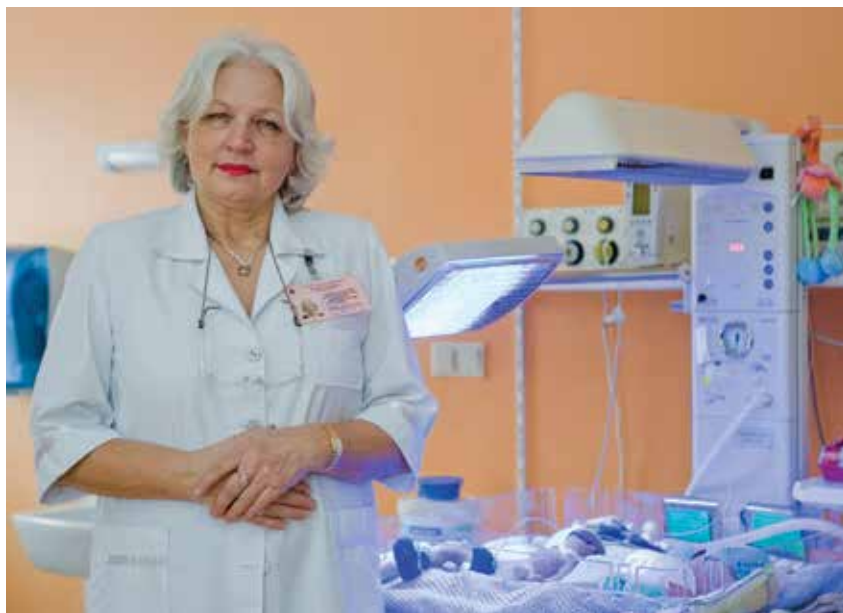
Visas dèmesys mažyliui

224. Is postpartum uterine involution impacted by instrumental or operative procedures? Ultrasound study / V. Paliulytė, G. S. Drąsutienė, D. Ramašauskaitė, D. Bartkevičienė, J. Zakarevičienė, J. Kurmanavičius // Open journal of obstetrics and gynecology . – 2018, vol. 8, no. 13, art. No. 88289, p. 1289–1304.