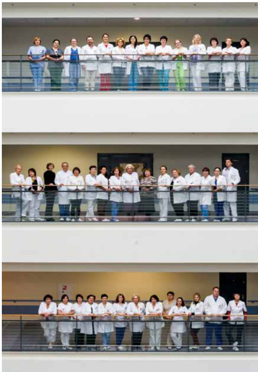
Vilniaus universiteto ligoninės Santaros klinikų Akušerijos ir ginekologijos centro darbuotojai