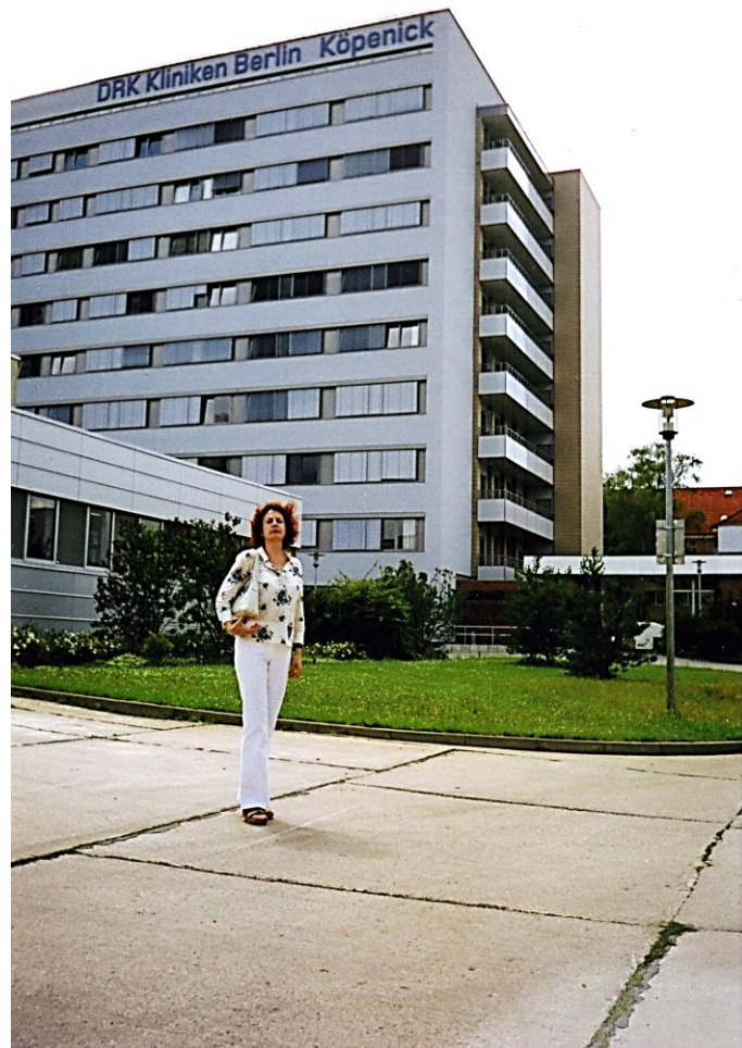
Stažuotė Berlyno Humboldto universiteto VRK Kiopeniko kliniku Neurologijos klinikoje. 2006 metai.