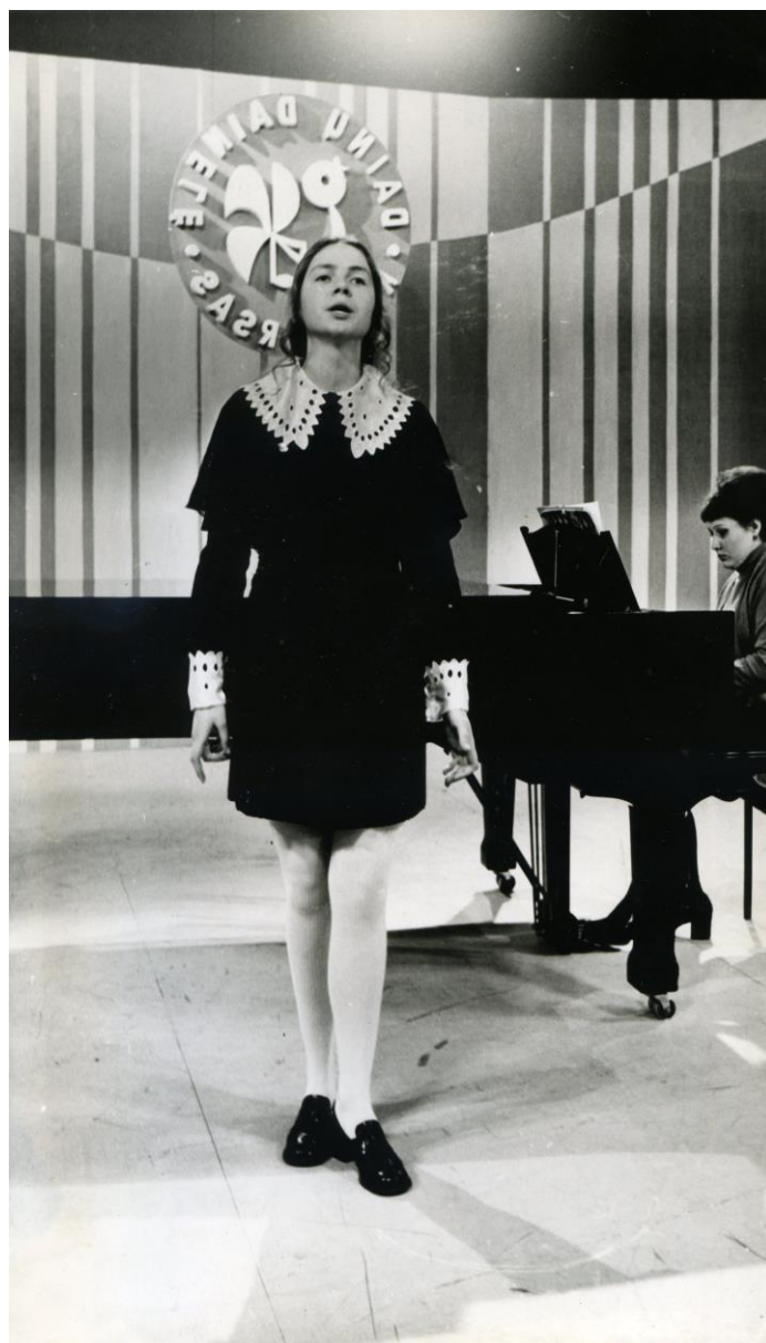
Respublikinio pirmojo „Dainų dainelės“ konkurso metu Lietuvos televizijos studijoje. 1974 metai.